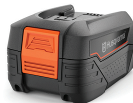
HUSQVARNA ASPIRE™ P4A 18- B72 970 60 09-01