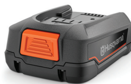
HUSQVARNA ASPIRE™ P4A 18- B45 970 60 08-01