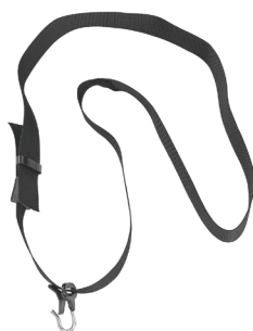
SUSPENSÓRIO DIAGONAL 537 21 62-01