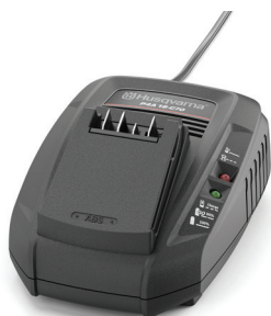
HUSQVARNA ASPIRE™ P4A 18- C70 970 60 10-01