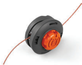
CABEÇA DE CORTE R25 - SUBSTITUIÇÃO RÁPIDA 534 16 18-02