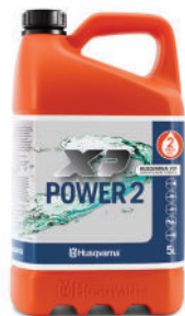
HUSQVARNA XP POWER 2T 583 95 29-01