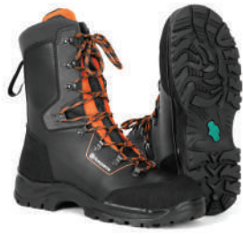
BOTAS DE PROTEÇÃO DE COURO COM PROTEÇÃO CONTRA MOTOSERRAS, CLASSIC 597 65 94-39