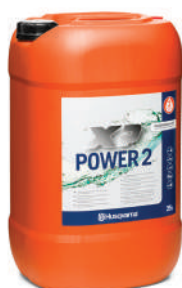
HUSQVARNA XP POWER 2T 583 95 29-02