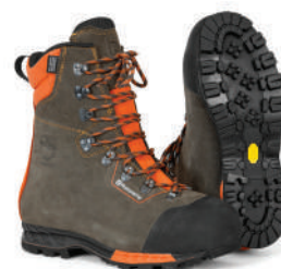
BOTAS DE PROTEÇÃO EM COURO COM PROTEÇÃO CONTRA MOTOSSERRA, FUNCIONAL 24 597 65 93-38