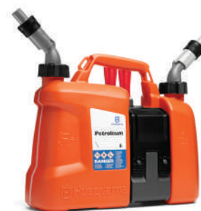
BIDÃO COMBI 5+2 L 580 75 42-01