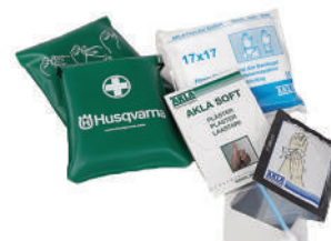
KIT DE EMERGÊNCIA PRIMEIROS SOCORROS 504 09 53-01