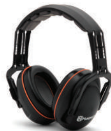
PROTECTORES ACÚSTICOS 505 66 53-04