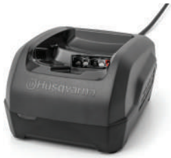
CARREGADOR HUSQVARNA QC250 967 97 01-01