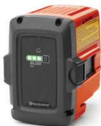
BATERIA BLI20 HUSQVARNA 967 09 17-01