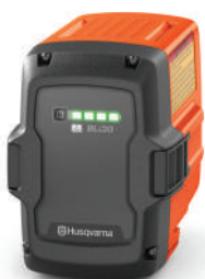
BATERIA HUSQVARNA BLI30 967 93 77-01