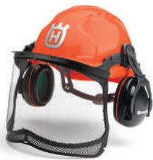
CAPACETE FLORESTAL CLASSIC 580 75 43-01