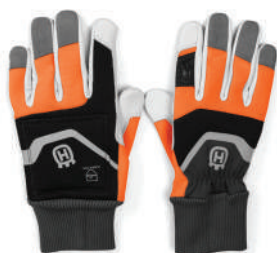
LUVA FUNCIONAL COM PROTEÇÃO ANTI-CORTE 595 00 39-07