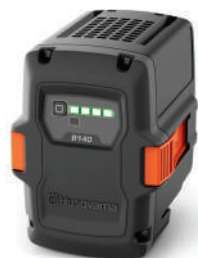
HUSQVARNA 40-B140 970 45 72-01