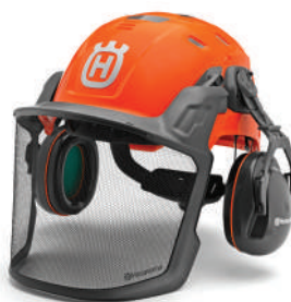
CAPACETE FLORESTAL, TECHNICAL 585 05 84-01