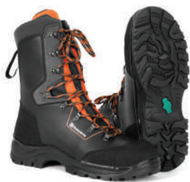
BOTAS DE PROTEÇÃO DE COURO COM PROTEÇÃO CONTRA MOTOSSERRAS, CLASSIC 597 65 94-45