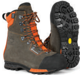
BOTAS DE PROTEÇÃO EM COURO COM PROTEÇÃO CONTRA MOTOSSERRA, FUNCIONAL 24 597 65 93-42