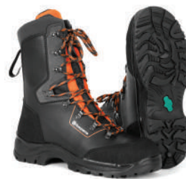
BOTAS DE PROTEÇÃO DE COURO COM PROTEÇÃO CONTRA MOTOSSERRAS, CLASSIC 597 65 94-47