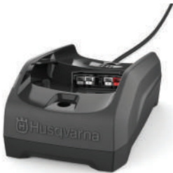
HUSQVARNA CHARGER 40-C80 970 48 78-01