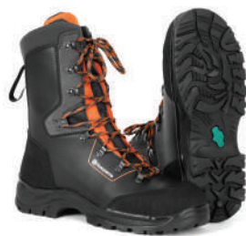
BOTAS DE PROTEÇÃO DE COURO COM PROTEÇÃO CONTRA MOTOSSERRAS, CLASSIC 597 65 94-46