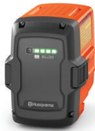
BATERIA HUSQVARNA BLI30 967 93 77-01