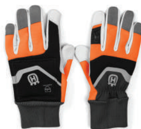
LUVA FUNCIONAL COM PROTEÇÃO ANTI-CORTE 595 00 39-07