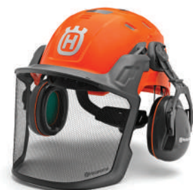
CAPACETE FLORESTAL, TECHNICAL 585 05 84-01