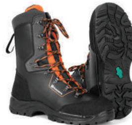
BOTAS DE PROTEÇÃO DE COURO COM PROTEÇÃO CONTRA MOTOSSERRAS, CLASSIC 597 65 94-42