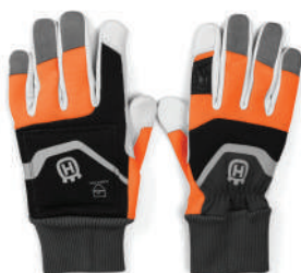
LUVA FUNCIONAL COM PROTEÇÃO ANTI-CORTE 595 00 39-10