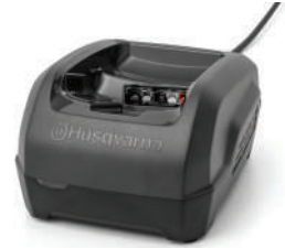
CARREGADOR HUSQVARNA QC250 967 97 01-01