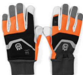
LUVA FUNCIONAL COM PROTEÇÃO ANTI-CORTE 595 00 39-09