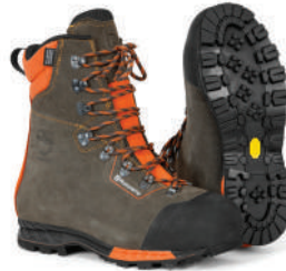
BOTAS DE PROTEÇÃO EM COURO COM PROTEÇÃO CONTRA MOTOSSERRA, FUNCIONAL 24 597 65 93-47