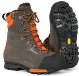
BOTAS DE PROTEÇÃO EM COURO COM PROTEÇÃO CONTRA MOTOSSERRA, FUNCIONAL 24 597 65 93-38