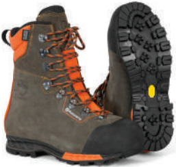
BOTAS DE PROTEÇÃO EM COURO COM PROTEÇÃO CONTRA MOTOSSERRA, FUNCIONAL 24 597 65 93-45