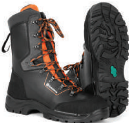
BOTAS DE PROTEÇÃO DE COURO COM PROTEÇÃO CONTRA MOTOSSERRAS, CLASSIC 597 65 94-40