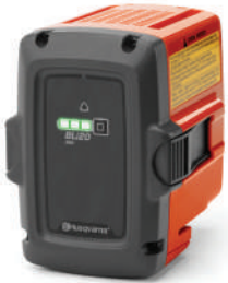
BATERIA BLI20 HUSQVARNA 967 09 17-01