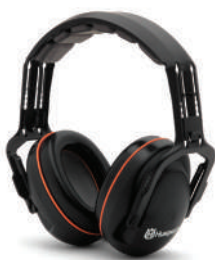
PROTECTORES ACÚSTICOS 505 66 53-04