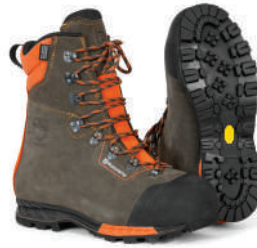
BOTAS DE PROTEÇÃO EM COURO COM PROTEÇÃO CONTRA MOTOSSERRA, FUNCIONAL 24 597 65 93-39