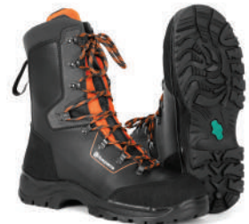
BOTAS DE PROTEÇÃO DE COURO COM PROTEÇÃO CONTRA MOTOSSERRAS, CLASSIC 597 65 94-43