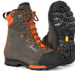
BOTAS DE PROTEÇÃO EM COURO COM PROTEÇÃO CONTRA MOTOSSERRA, FUNCIONAL 24 597 65 93-43