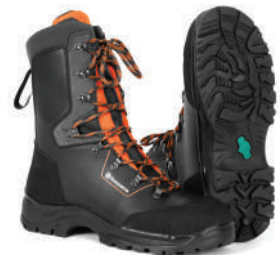
BOTAS DE PROTEÇÃO DE COURO COM PROTEÇÃO CONTRA MOTOSSERRAS, CLASSIC 597 65 94-39