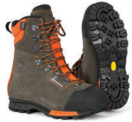
BOTAS DE PROTEÇÃO EM COURO COM PROTEÇÃO CONTRA MOTOSSERRA, FUNCIONAL 24 597 65 93-40