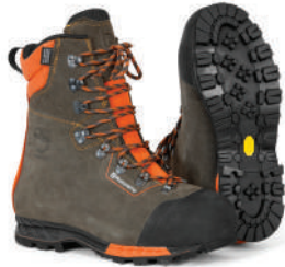
BOTAS DE PROTEÇÃO EM COURO COM PROTEÇÃO CONTRA MOTOSSERRA, FUNCIONAL 24 597 65 93-46