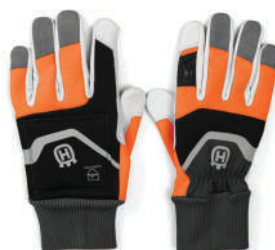
LUVA FUNCIONAL COM PROTEÇÃO ANTI-CORTE 595 00 39-12