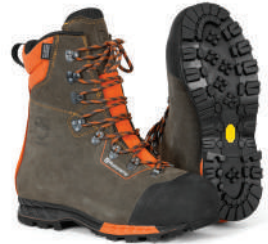
BOTAS DE PROTEÇÃO EM COURO COM PROTEÇÃO CONTRA MOTOSSERRA, FUNCIONAL 24 597 65 93-44