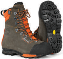
BOTAS DE PROTEÇÃO EM COURO COM PROTEÇÃO CONTRA MOTOSSERRA, FUNCIONAL 24 597 65 93-41