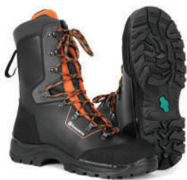
BOTAS DE PROTEÇÃO DE COURO COM PROTEÇÃO CONTRA MOTOSSERRAS, CLASSIC 597 65 94-44