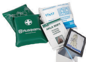
KIT DE EMERGÊNCIA PRIMEIROS SOCORROS 504 09 53-01