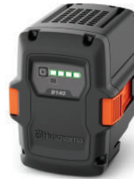
HUSQVARNA 40-B140 970 45 72-01