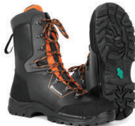
BOTAS DE PROTEÇÃO DE COURO COM PROTEÇÃO CONTRA MOTOSSERRAS, CLASSIC 597 65 94-41