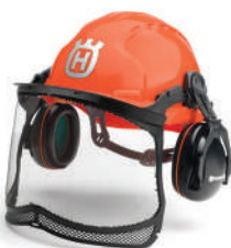
CAPACETE FLORESTAL CLASSIC 580 75 43-01