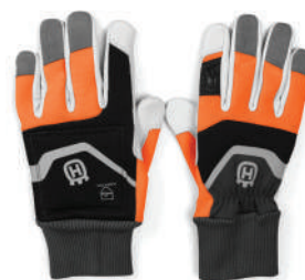
LUVA FUNCIONAL COM PROTEÇÃO ANTI-CORTE 595 00 39-08