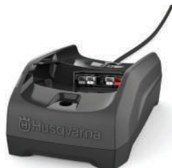
HUSQVARNA CHARGER 40-C80 970 48 78-01