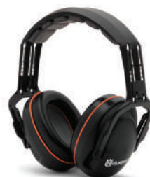
PROTECTORES ACÚSTICOS 505 66 53-04