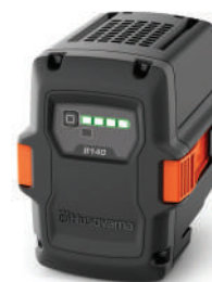
HUSQVARNA 40-B140 970 45 72-01