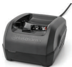
CARREGADOR HUSQVARNA QC250 967 97 01-01