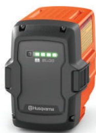
BATERIA HUSQVARNA BLI30 967 93 77-01