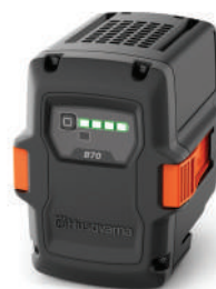
HUSQVARNA 40-B70 970 45 71-01