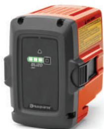
BATERIA BLI20 HUSQVARNA 967 09 17-01