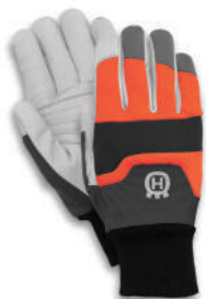
LUVA FUNCIONAL COM PROTEÇÃO ANTI-CORTE 595 00 39-07