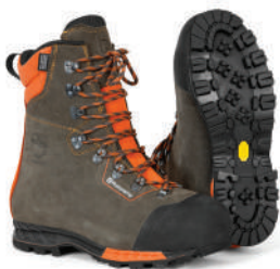
BOTAS DE PROTEÇÃO EM COURO COM PROTEÇÃO CONTRA MOTOSSERRA, FUNCIONAL 24 597 65 93-43