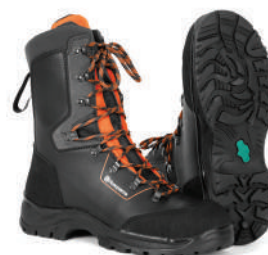
BOTAS DE PROTEÇÃO DE COURO COM PROTEÇÃO CONTRA MOTOSSERRAS, CLASSIC 597 65 94-45