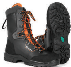
BOTAS DE PROTEÇÃO DE COURO COM PROTEÇÃO CONTRA MOTOSSERRAS, CLASSIC 597 65 94-47