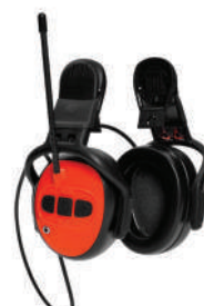
PROTECTORES AURICULARES COM RÁDIO FM 578 27 49-03