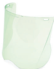
VISEIRA ANTIEMBACIANTE 505 66 53-63