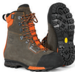
BOTAS DE PROTEÇÃO EM COURO COM PROTEÇÃO CONTRA MOTOSSERRA, FUNCIONAL 24 597 65 93-41