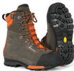
BOTAS DE PROTEÇÃO EM COURO COM PROTEÇÃO CONTRA MOTOSSERRA, FUNCIONAL 24 597 65 93-40