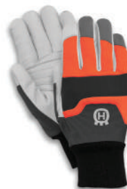
LUVA FUNCIONAL COM PROTEÇÃO ANTI-CORTE 595 00 39-09