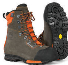
BOTAS DE PROTEÇÃO EM COURO COM PROTEÇÃO CONTRA MOTOSSERRA, FUNCIONAL 24 597 65 93-46