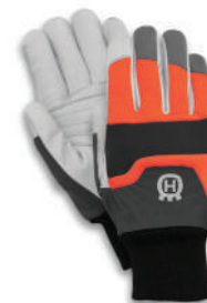
LUVA FUNCIONAL COM PROTEÇÃO ANTI-CORTE 595 00 39-10