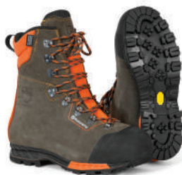
BOTAS DE PROTEÇÃO EM COURO COM PROTEÇÃO CONTRA MOTOSSERRA, FUNCIONAL 24 597 65 93-44