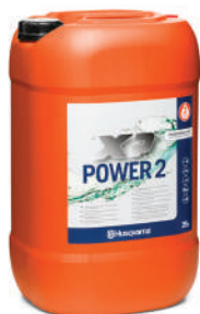
HUSQVARNA XP POWER 2T 583 95 29-02