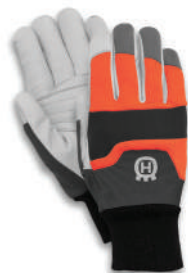
LUVA FUNCIONAL COM PROTEÇÃO ANTI-CORTE 595 00 39-08