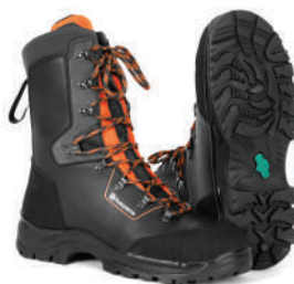
BOTAS DE PROTEÇÃO DE COURO COM PROTEÇÃO CONTRA MOTOSSERRAS, CLASSIC 597 65 94-40