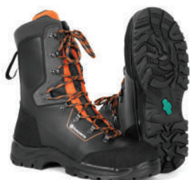
BOTAS DE PROTEÇÃO DE COURO COM PROTEÇÃO CONTRA MOTOSSERRAS, CLASSIC 597 65 94-43