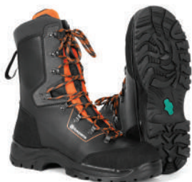
BOTAS DE PROTEÇÃO DE COURO COM PROTEÇÃO CONTRA MOTOSSERRAS, CLASSIC 597 65 94-46