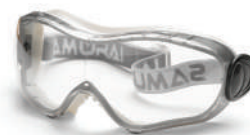
ÓCULOS DE PROTEÇÃO, GOGGLES 544 96 39-01