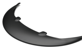
PALA DE SOL PARA VISEIRA 578 17 98-01