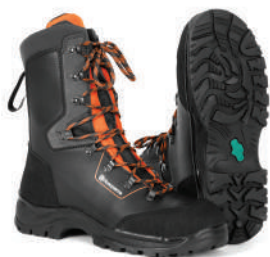
BOTAS DE PROTEÇÃO DE COURO COM PROTEÇÃO CONTRA MOTOSSERRAS, CLASSIC 597 65 94-39