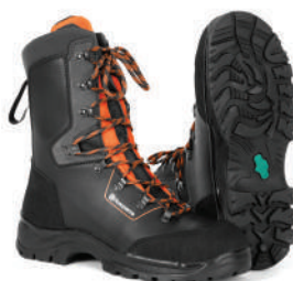
BOTAS DE PROTEÇÃO DE COURO COM PROTEÇÃO CONTRA MOTOSSERRAS, CLASSIC 597 65 94-44