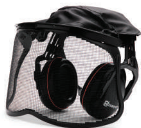
VISEIRA DE REDE 505 66 53-58