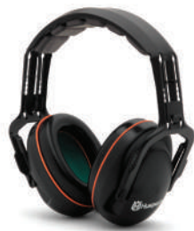
PROTECTORES ACÚSTICOS 505 66 53-04