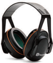
PROTEÇÃO AURICULAR JARDINEIRO | PACOTE DE 10 505 69 90-12