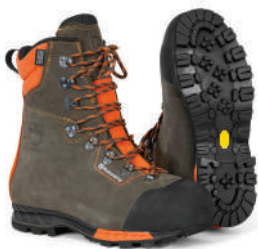
BOTAS DE PROTEÇÃO EM COURO COM PROTEÇÃO CONTRA MOTOSSERRA, FUNCIONAL 24 597 65 93-39