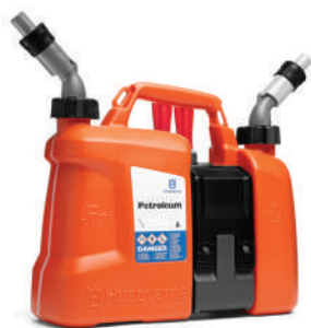
BIDÃO COMBI 5+2 L 580 75 42-01