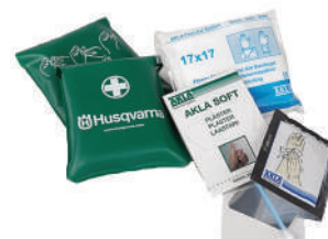
KIT DE EMERGÊNCIA PRIMEIROS SOCORROS 504 09 53-01