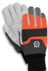
LUVA FUNCIONAL COM PROTEÇÃO ANTI-CORTE 595 00 39-12