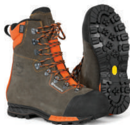
BOTAS DE PROTEÇÃO EM COURO COM PROTEÇÃO CONTRA MOTOSSERRA, FUNCIONAL 24 597 65 93-45