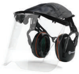
WISEIRA EM PLEXIGLAS 505 66 53-48