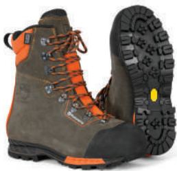
BOTAS DE PROTEÇÃO EM COURO COM PROTEÇÃO CONTRA MOTOSSERRA, FUNCIONAL 24 597 65 93-47