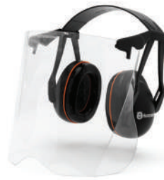
PROTECTORES AURICULARES COM VISEIRA, GARDENER 505 66 53-60