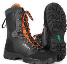
BOTAS DE PROTEÇÃO DE COURO COM PROTEÇÃO CONTRA MOTOSSERRAS, CLASSIC 597 65 94-42