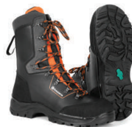
BOTAS DE PROTEÇÃO DE COURO COM PROTEÇÃO CONTRA MOTOSSERRAS, CLASSIC 597 65 94-41