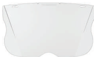
VISEIRA PERSPEX 505 66 53-43