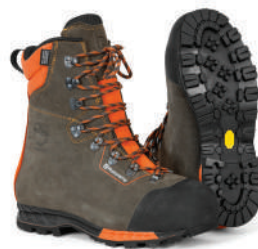
BOTAS DE PROTEÇÃO EM COURO COM PROTEÇÃO CONTRA MOTOSSERRA, FUNCIONAL 24 597 65 93-42