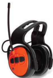
PROTEÇÃO AURICULAR COM RÁDIO FM, ARMAÇÃO PARIETAL 505 66 53-79