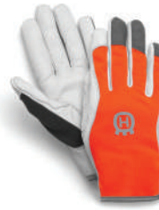
LUVA CLASSIC LIGHT 596 31 06-07