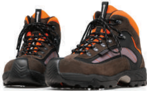
BOTAS DE PROTEÇÃO TECHNICAL 596 30 64-40