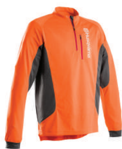
T-SHIRT DE TRABALHO DE MANGA COMPRIDA, TECHNICAL 50172 03-58