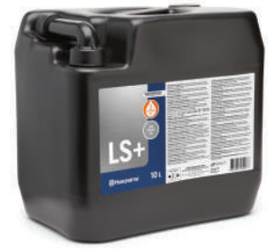
ÓLEO DE 2 TEMPOS HVA LS+ 578 18 00-02