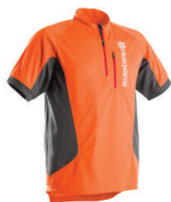
T-SHIRT DE TRABALHO DE MANGA CURTA, TECHNICAL 50171 59-54