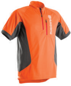
T-SHIRT DE TRABALHO DE MANGA CURTA, TECHNICAL 501 71 59-62