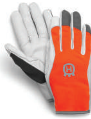
LUVA CLASSIC LIGHT 596 31 06-06