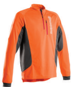
T-SHIRT DE TRABALHO DE MANGA COMPRIDA, TECHNICAL 50172 03-54