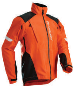
CASACO PARA ROÇAGEM TECHNICAL 580 68 82-46