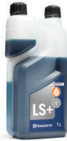
ÓLEO DE 2 TEMPOS HVA LS+ 578 03 70-02