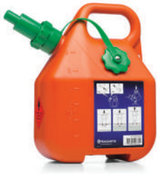
BIDÃO COMBUSTIVEL 6 LITROS LARANJA 505 69 80-01