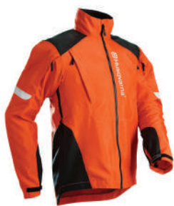
CASACO PARA ROÇAGEM TECHNICAL 580 68 82-62