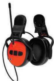
PROTETORES AURICULARES COM RÁDIO FM 578 27 49-04