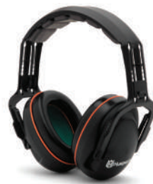
PROTECTORES ACÚSTICOS 505 66 53-04