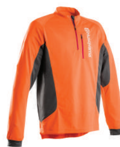
T-SHIRT DE TRABALHO DE MANGA COMPRIDA, TECHNICAL 50172 03-62