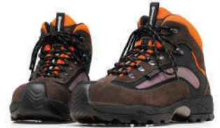
BOTAS DE PROTEÇÃO TECHNICAL 596 30 64-43