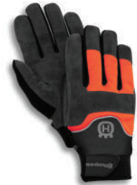
LUVA TECHNICAL LIGHT 596 30 92-10