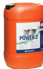
HUSQVARNA XP POWER 2T 583 95 29-02