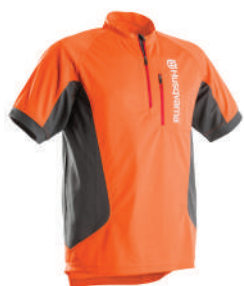
T-SHIRT DE TRABALHO DE MANGA CURTA, TECHNICAL 50171 59-46