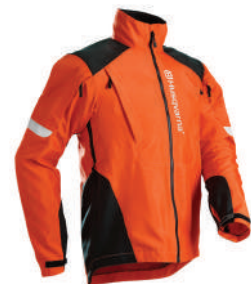
CASACO PARA ROÇAGEM TECHNICAL 580 68 82-58