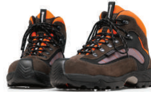
BOTAS DE PROTEÇÃO TECHNICAL 596 30 64-42