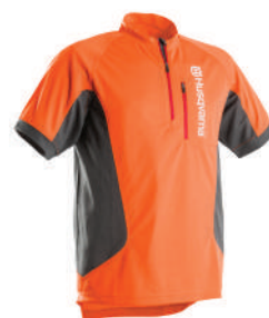
T-SHIRT DE TRABALHO DE MANGA CURTA, TECHNICAL 50171 59-58