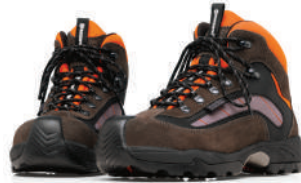
BOTAS DE PROTEÇÃO TECHNICAL 596 30 64-41