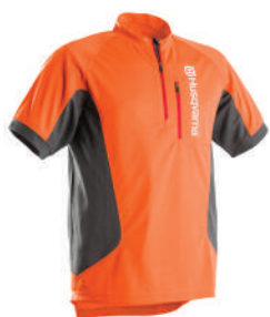
T-SHIRT DE TRABALHO DE MANGA CURTA, TECHNICAL 50171 59-50