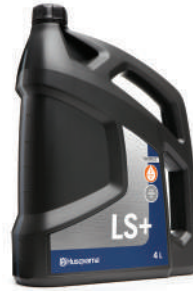
ÓLEO DE 2 TEMPOS HVA LS+ 578 03 71-02