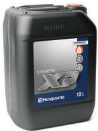
ÓLEO DE 2 TEMPOS, XP® SINTÉTICO 578 18 00-03