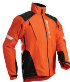
CASACO PARA ROÇAGEM TECHNICAL 580 68 82-50