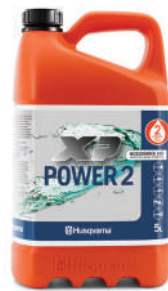
HUSQVARNA XP POWER 2T 583 95 29-01