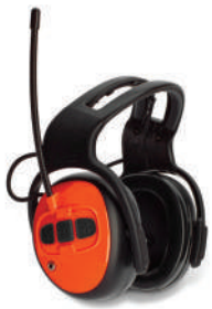
PROTETORES AURICULARES COM RÁDIO FM 578 27 49-03