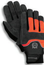
LUVA TECHNICAL LIGHT 596 30 92-08