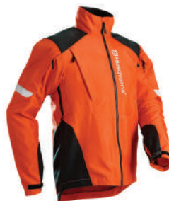
CASACO PARA ROÇAGEM TECHNICAL 580 68 82-54