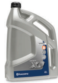
ÓLEO DE 2 TEMPOS, XP® SINTÉTICO 578 03 71-03