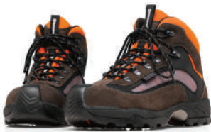
BOTAS DE PROTEÇÃO TECHNICAL 596 30 64-44