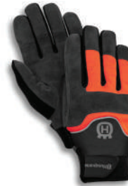
LUVA TECHNICAL LIGHT 596 30 92-09