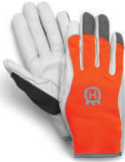
LUVA CLASSIC LIGHT 596 31 06-10