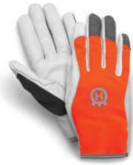
LUVA CLASSIC LIGHT 596 31 06-08