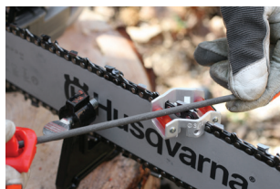
CORTE INTENSIVO 510 09 57-02