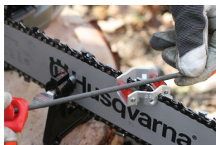
CORTE INTENSIVO 597 35 48-02