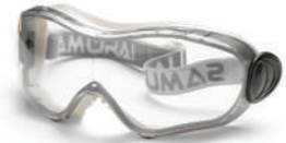
ÓCULOS DE PROTEÇÃO, GOGGLES 544 96 39-01