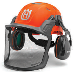
CAPACETE FLORESTAL, TECHNICAL 585 05 84-01