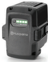
HUSQVARNA BATERIA BL1200 967 09 19-01