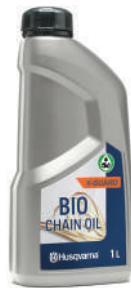
ÓLEO DE CORRENTE HUSQVARNA X-GUARD BIO 596 45 73-01