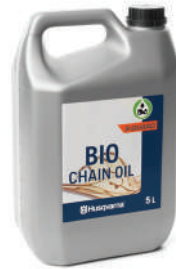
ÓLEO DE CORRENTE HUSQVARNA X-GUARD BIO 596 45 73-02