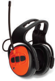
PROTETORES AURICULARES COM RÁDIO FM 578 27 49-03