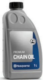
ÓLEO DE CORRENTE MINERAL 579 39 60-01