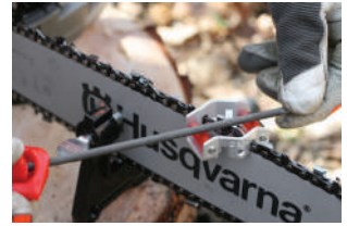
CORTE INTENSIVO 510 09 57-02