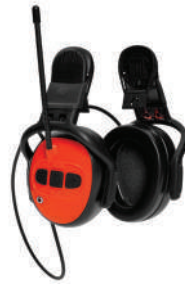
PROTETORES AURICULARES COM RÁDIO FM 578 27 49-04