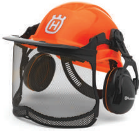
CAPACETE FLORESTAL, FUNCIONAL 576 41 24-02