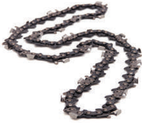
CORRENTE DE MOTOSERRA HOOKITS DE LIMAS 1/4" 1,3MM 501 84 40-64