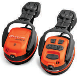
X-COM R MONTAGEM DO CAPACETE 595 08 42-01