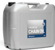
ÓLEO DE CORRENTE MINERAL 579 39 62-01