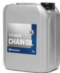
ÓLEO DE CORRENTE MINERAL 579 39 61-01