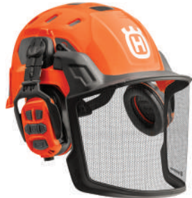
CAPACETE FLORESTAL X-COM R TECHNICAL 595 08 43-01