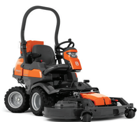
HUSQVARNA P 524XR EFI 970 60 17-01