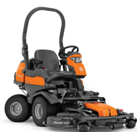
HUSQVARNA P 524X 970 60 15-01